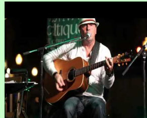
Musique: Conrad Lemieux

N.B. Le lavage de main, le port du masque (lors de déplacement) et l'espace de 1 mètre sont recommandés.